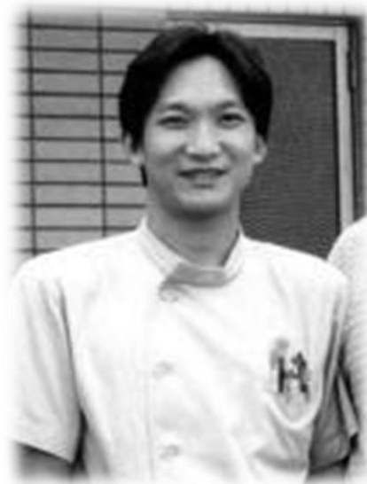
29歳で逮捕された大助さんは1日も出られずに44歳になりました。

弁護士や当時の同僚の方の話を聞くことで、大助さんが犯人では無い事がはっきり解ります。1人でも多くの方のご参加をお待ちしています。